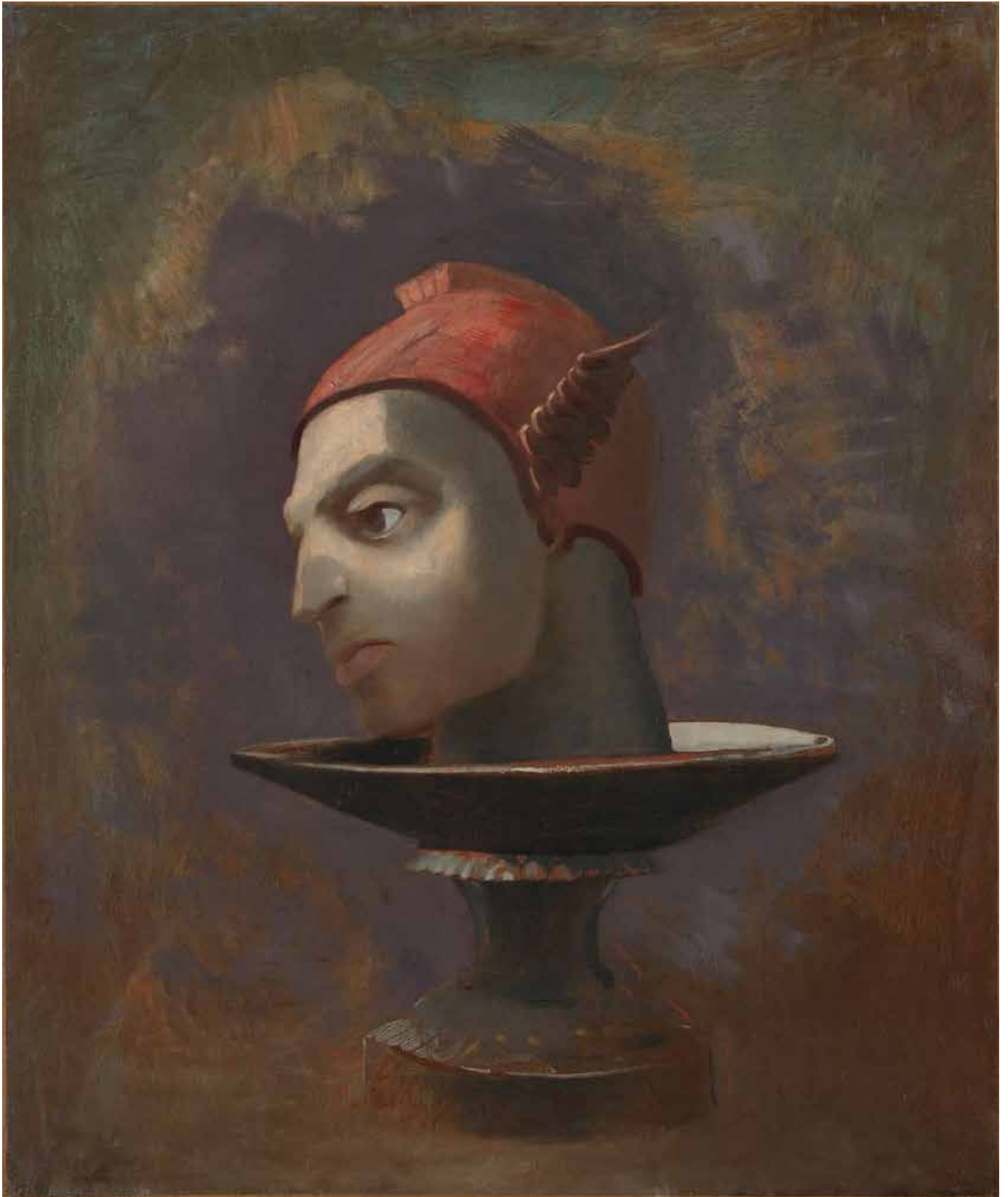
Odilon Redon, Tête de Persée , circa 1875