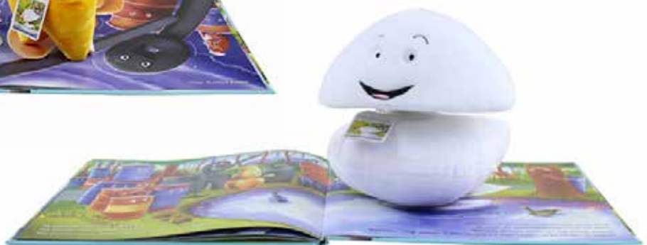
Producten uit de 'Zwaan-lijn' in de museumwinkel