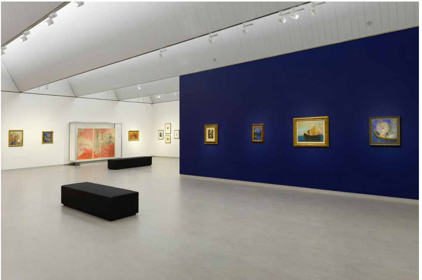
Tentoonstelling Odilon Redon. La littérature et la musique