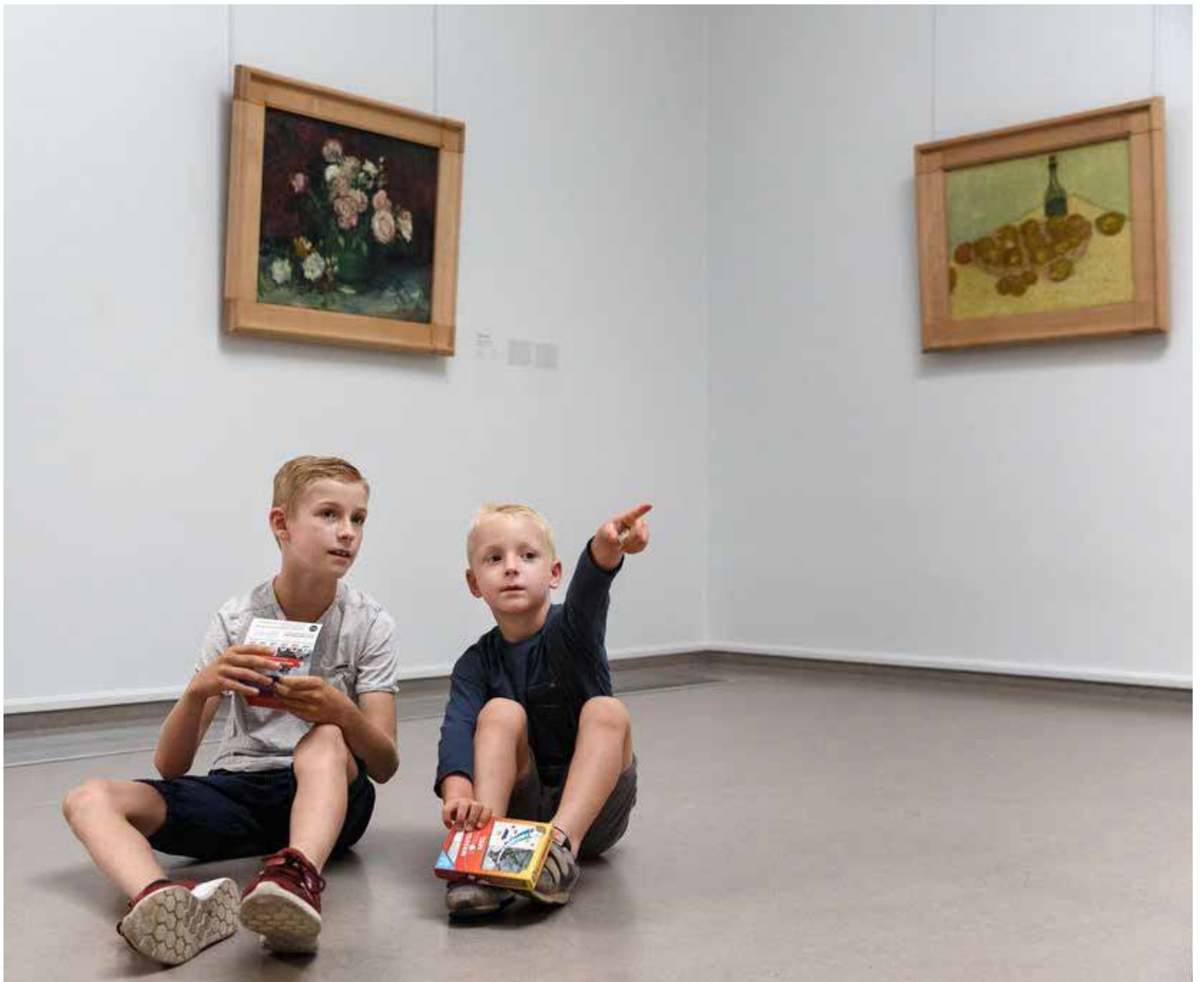
Kinderen met het Museumdobbelspel