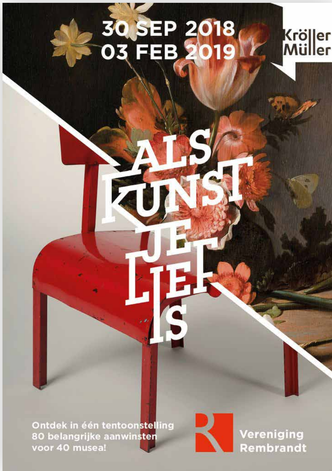
Campagnebeeld Als kunst je lief is