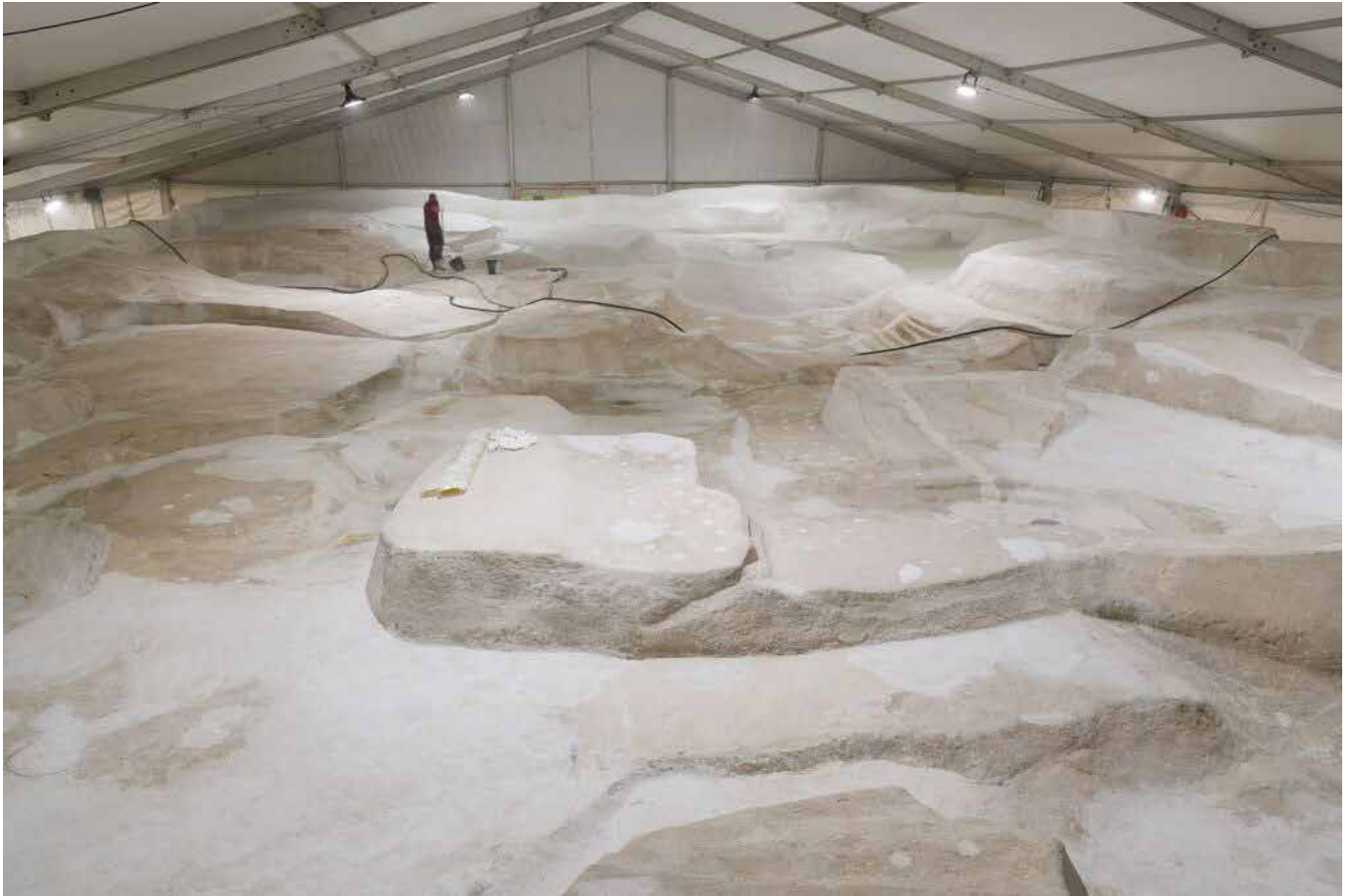
Restauratie van Jardin d'Émail in een werktent