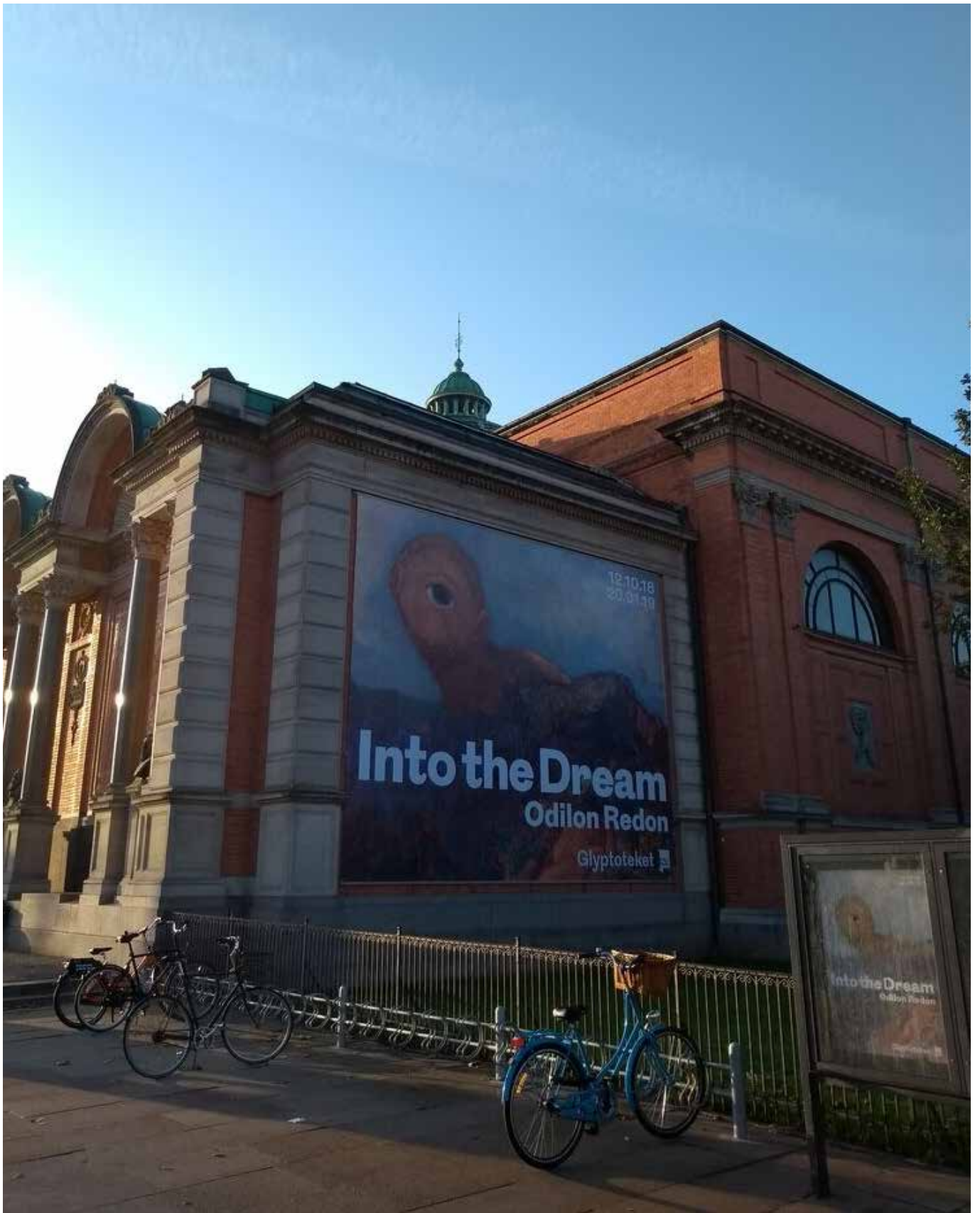
Redontentoonstelling in de NY Carlsberg Glyptotek in Kopenhagen