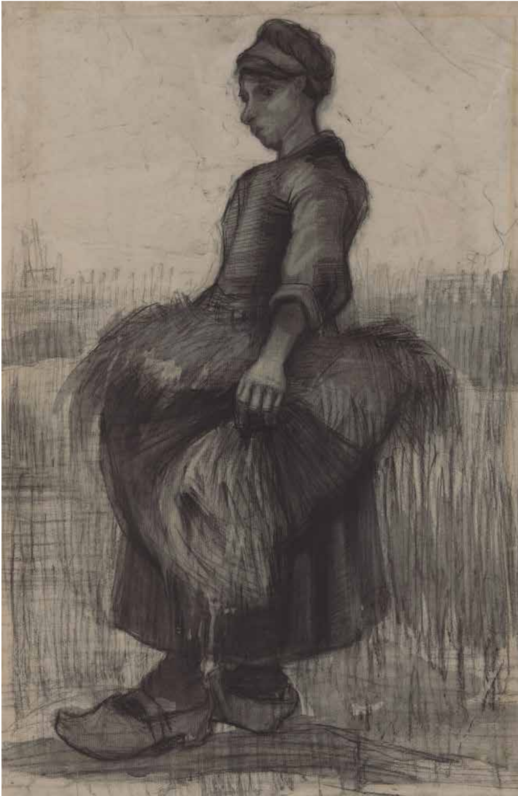
Vincent van Gogh, Boerin met koren in haar schort , 1885